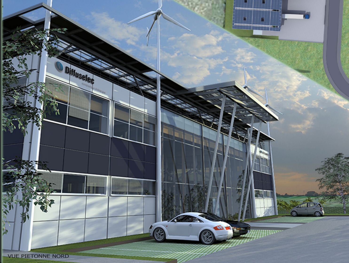
VUE PIETONNE NORD